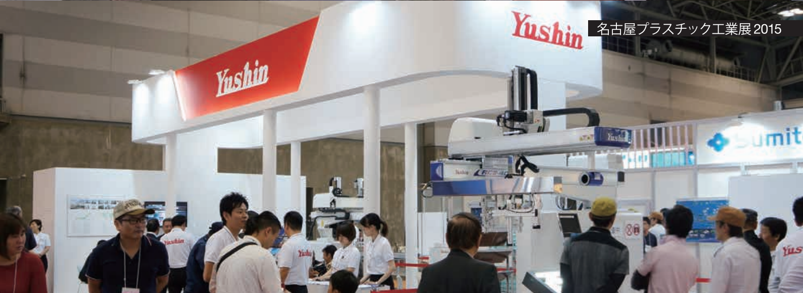
名古屋プラスチック工業展 2015